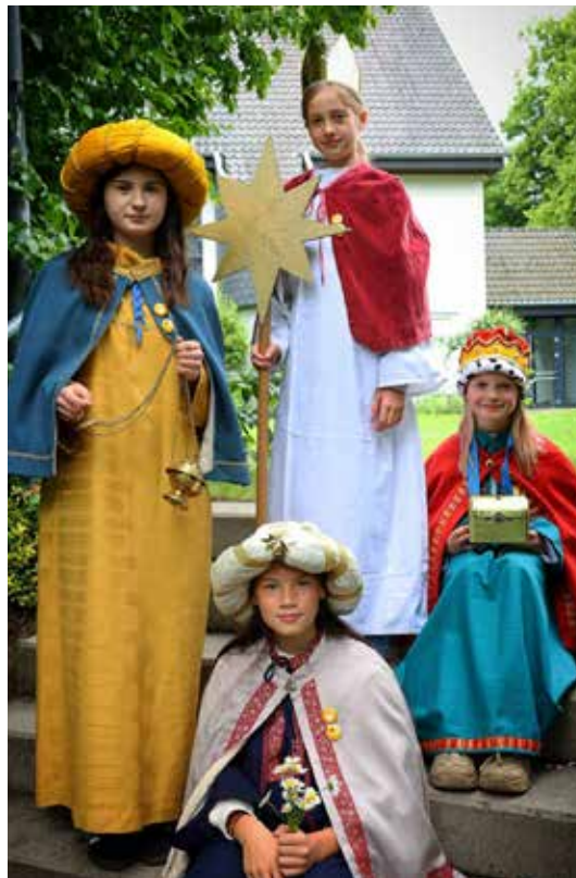
Die vier Mädchen aus der Pfarrgemeinde St. Franziskus Marl freuen sich schon auf die Reise nach Rom und in den Vatikan.

Doch auch die zwölf anderen Gruppen gehen nicht leer aus: Alle, die am Kreativwettbewerb teilgenommen haben, erhalten einen Ehrenplatz im Gottesdienst zur Bundesweiten Eröffnung der Aktion Dreikönigssingen am 29. Dezember 2026 in Münster.