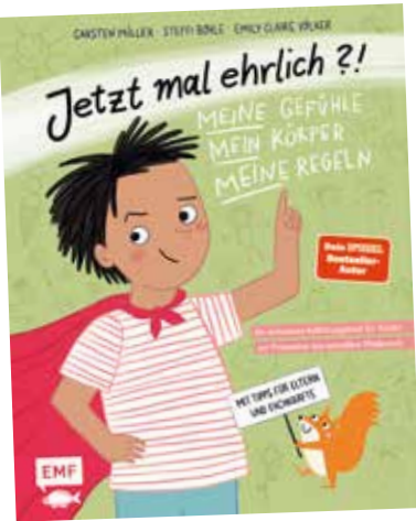
Ausschnitt aus Carsten Müllers neuem Buch "Jetzt mal ehrlich" (Verlag EMF)