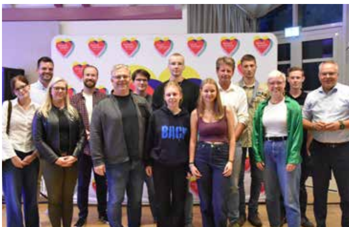
Die Veranstaltung war Teil der Kampagne „MenschNRW! Lebe Freiheit!“, die der BDKJ DV Münster gemeinsam mit dem Bistum und dem Caritasverband Münster ins Leben gerufen hat.