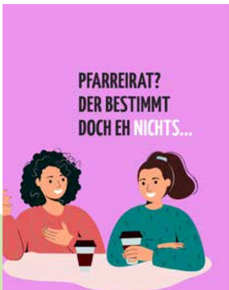
Mit einer Social-Media-Kampagne hat der BDKJ Diözese Münster in den letzten Wochen über die Wahlen in den Pfarreirat und Kirchenvorstand informiert und dabei auch mit dem ein oder anderen Vorurteil aufgeräumt.