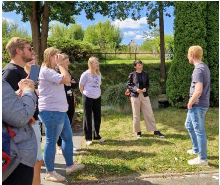
NRW-Jugendministerin Josefine Paul (2.v.r.) war bei ihrer Sommertour zunächst zu Besuch bei der CAJ Sonsbeck...

Ministerin Paul erkundigte sich nach dem Alltag, dem Aufwand und den Kosten der Freizeiten. Die meisten Ferienfreizeiten, die in sauerländischen Schützenhallen