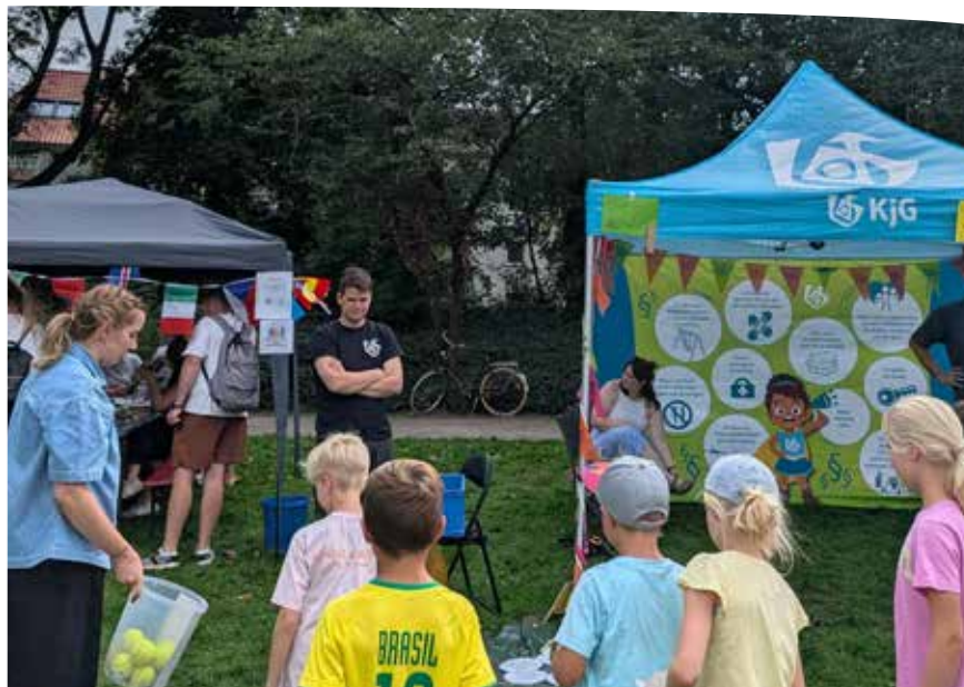
Der Stand der KjG wurde durch Helfer*innen aus dem Büroteam, des Diözesanausschusses sowie der Diözesanleitung betreut und organisiert.

An dieser Stelle gilt ein großer Dank dem Kinderschutzbund Münster, der so ein eindrucksvolles Event an diesem besonderen Tag auf die Beine gestellt hat!