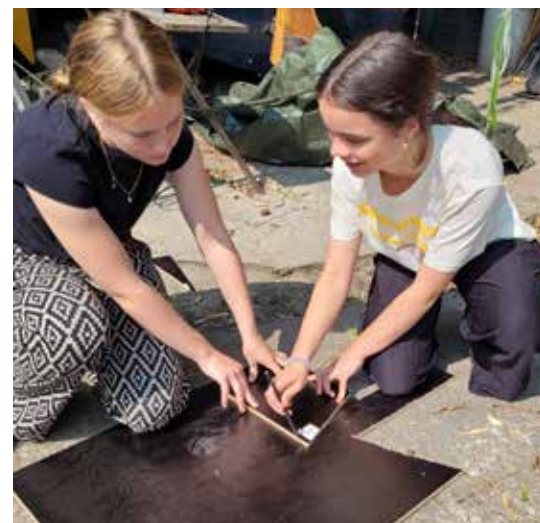
Die Ferienfreizeit 2025 der Caravelles (13-16 Jahre) vom Pfadfinderstamm Sendenhorst fand auf einem Tretboot zwischen Wetzlar und Laurenburg auf der Lahn statt.