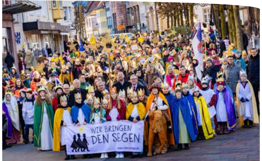
Bei der Bundesweiten Eröffnung der Aktion Dreikönigssingen am 28. Dezember 2024 im Nachbarbistum Paderborn haben über 1.800 Sternsinger*innen und Begleitpersonen teilgenommen. 2026 werden der BDKJ und das Bistum Münster zur Eröffnungsfeier einladen.

Der Startschuss für die Bundesweite Eröffnungsfeier fällt aber schon fast ein Jahr zuvor, zum Jahreswechsel 2025/2026. Dann wird eine Sternsingergruppe aus Marl (Kreis Recklinghausen) bei der Neujahrsmesse des Papstes in Rom dabei sein. Außerdem übergibt das Bistum Freiburg Ende 2025 bei der diesjährigen Bundesweiten Eröffnungsfeier den Staffelstern an das Bistum Münster.