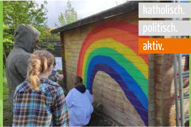
V.l.: Gedenkort für Sternenkinder (Aktion der Kolpingjugend Münster und Messdienerleiterrunde Liebfrauen-Überwasser), Neugestaltung des Pfarrheimgartens in Ottmarsbocholt (Aktion der PSG)