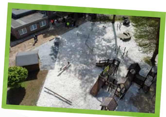
Vorher-Nachher-Bilder der 72-Stunden-Aktions-Projekte (v.o.n.u.): Beachvolleyballfeld der KLJB Ahlen, Rasthütte der KLJB Erle-Rhade, Barfußpfad der KLJB Hopsten und Kindertartenspielfeld der KLJB Lippamsdorf