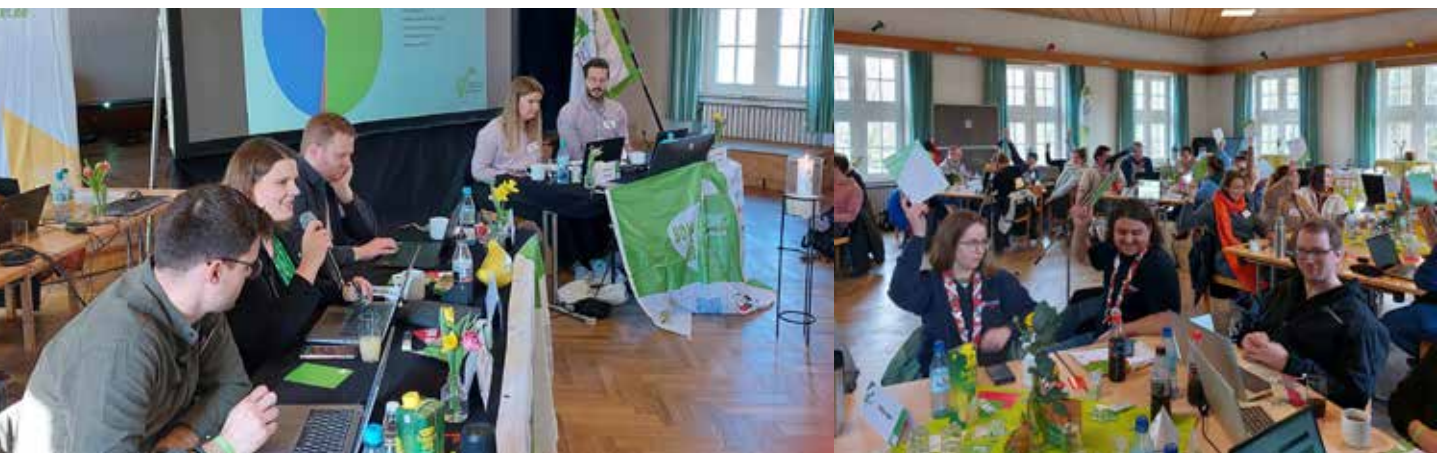
Am Vormittag des ersten Versammlungstages stellte der Diözesanvorstand seinen Jahresbericht 2023 und die Finanzplanung für das kommende Jahr vor. Am Nachmittag wählten die Delegierten zwei neue Diözesanvorstände.

Weitere Wahlen führten die Verbandsdelegierten zur personellen Besetzung des Diözesanleitungsrats und internen Ausschüssen durch. Mit letzten Vorbereitungen stimmten sich die Delegierten zudem auf die einen Monat später stattfindende 72-Stunden-Aktion ein. Zahlreiche Grußworte, ein gemeinsamer Gottesdienst in der Michaelskapelle und der anschließende Abend im Burgkeller haben die Diözesanversammlung 2024 abgerundet.