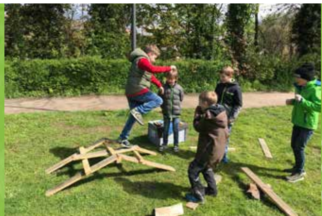
Impressionen der 72-Stunden-Aktionen: Jugendheim St. Joseph Dülmen (Aktion der PSG) (links), Lagertag für Kinder mit und ohne Migrationshintergrund in Warendorf (Aktion der DPSG) (rechts).