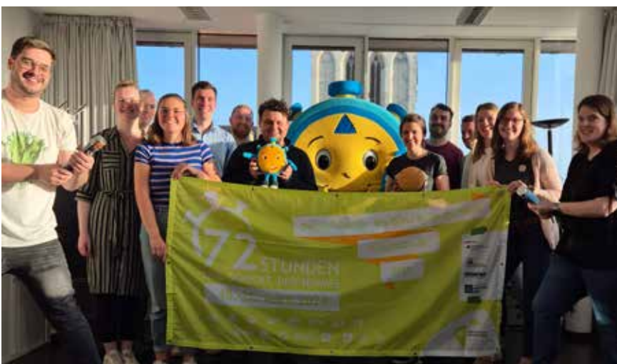
Die für die Vorbereitungen der 72-Stunden-Aktion zuständigen Leitungen der Koordinationsbüros und des BDKJ gaben am 18. April um 17:07 Uhr den Startschuss für die Aktion 2024.