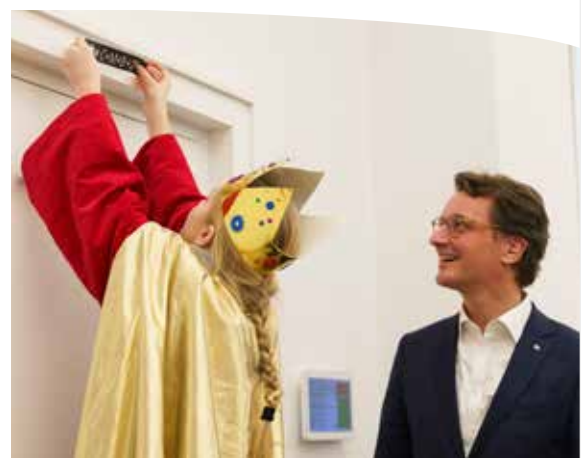
Ministerpräsident Hendrik Wüst freut sich über den Sternsingersegel über der Tür zu seinem Büro