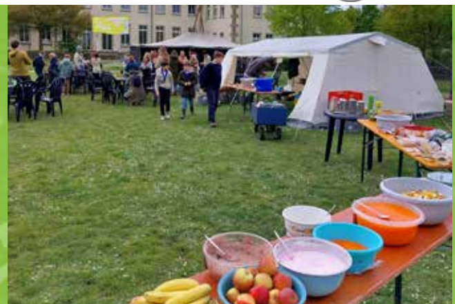
V.l.: Die Schützen der Hubertus-Gilde Keylaer verschönerten den Außenbereich der Kindertagesstätte, der DPSG-Stamm St. Franziskus Münster organisierte ein Spendenessen für die ganze Nachbarschaft.