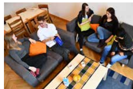
Das Borromaeum ist ein Haus der katholischen Kirche im Bistum Münster. Die Mitglieder der Hausgemeinschaft tragen zum Gelingen des Gemeinschaftslebens bei und wirken an der Gestaltung des Hausprogramms mit

Weitere Erfahrungsberichte, eine Stellenbörse und Beratungsmöglichkeiten rund um das Freiwillige Soziale Jahr (FSJ) findest du unter: https://www.fsd-muenster.de/