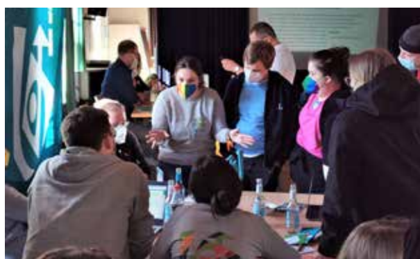
40 stimmberechtigte Delegierte und beratende Gäste der KjG-Diözesankonferenz tagten im März auf der Jugendburg Gemen.