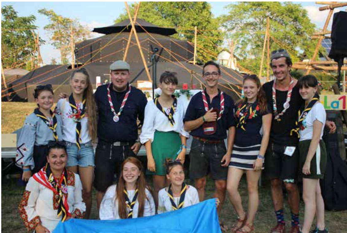
Erinnerungen an friedliche Zeiten: Das Bundesjugendlager 2018 in Speyer von der Malteser Jugend Ivano-Frankivsk

Spendenaktion der Malteser Jugend für die Ukraine