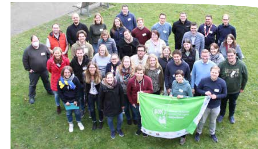
Die Delegierten der BDKJ-Diözesanversammlung 2022

Ebenfalls einstimmig nahm die Diözesanversammlung den Antrag „Für eine Kirche ohne Angst - #loveislove“ mit Änderungen an. Alle gleichberechtigt geführten Beziehungsformen werden darin