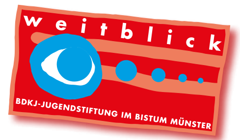
Das Projekt WortGewandt wurde von der BDKJ-Jugendstiftung weitblick gefördert