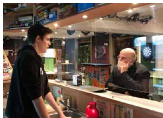
Bei der SAG AN!-Tour Ende 2021 hörte sich das Projektteam zusammen mit Bischof Felix Genn die Geschichten junger Menschen in Schulen und Jugendzentren im Bistum Münster persönlich an. Diese fließen jetzt in die Interpretationsphase ein