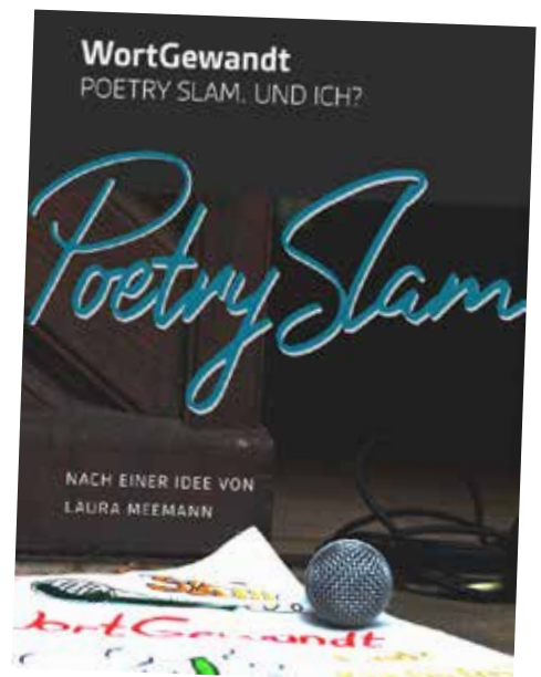
Das Buch „WortGewandt“ dokumentiert Texte aus den Poetry Slams „Wortgewandt“ mit christlichen Themen.