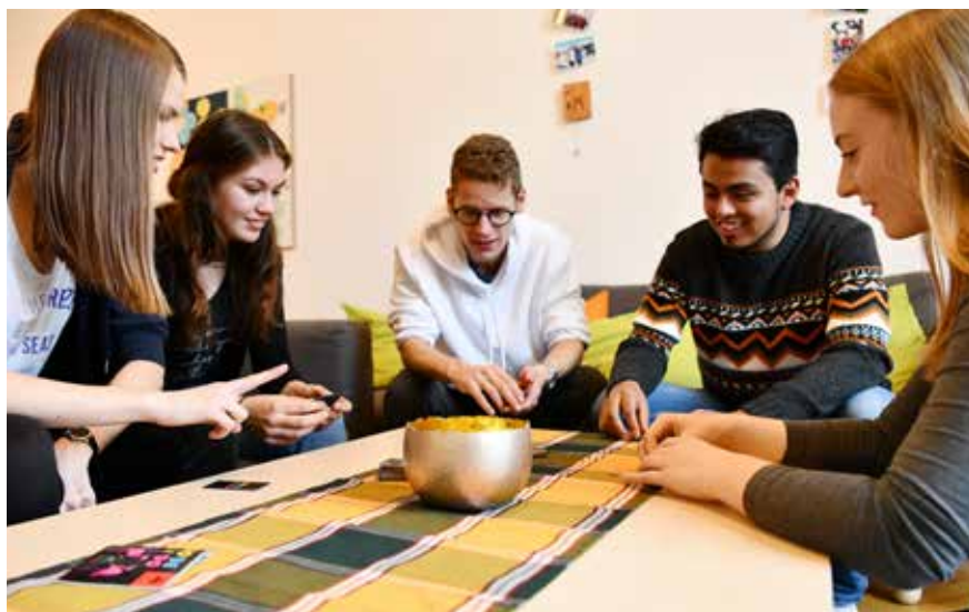
Die Hausgemeinschaft im Borromaeum setzt sich zusammen aus den Priesterkandidaten verschiedener Bistümer, Studierenden verschiedener Studienfächer, Teilnehmer*innen am Sprachenjahr und am Orientierungsjahr, promovierenden Priestern aus der Weltkirche und den Priestern des Seminarkollegiums

Vor meinem Freiwilligem Sozialem Jahr bei der KjG hatte ich kaum Anknüpfungspunkte zur Jugendverbandsarbeit und war nur vor Ort in meiner Heimatpfarre aktiv. Während des Freiwilligendienstes konnte ich all die Eigen- und Besonderheiten, Stärken und Möglichkeiten, die die Arbeit in Jugendverbänden bietet,