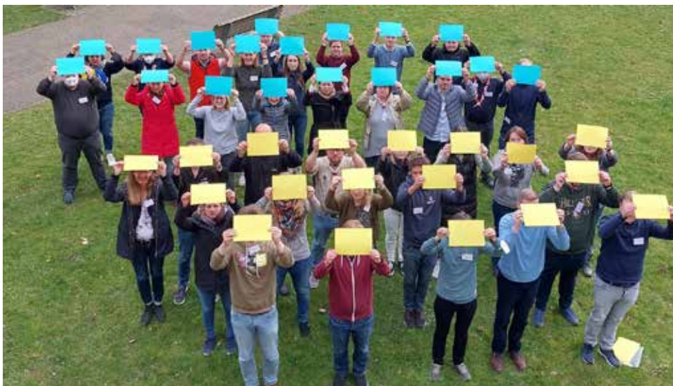
Aufruf zu Frieden und Sicherheit in Europa. Die Delegierten der Diözesanversammlung setzten mit ihrer Fotoaktion ein Zeichen für die Menschen in der Ukraine

In einer gemeinsamen Fotoaktion riefen die Delegierten schließlich zu Frieden und Sicherheit in Europa auf.